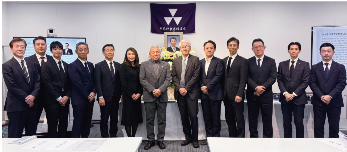
偲ぶ会に参加したOBの皆さま