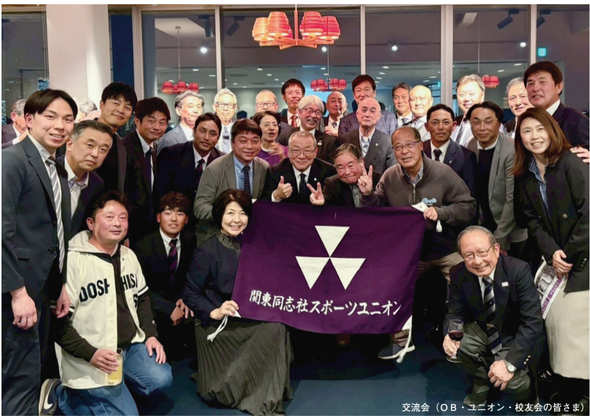
交流会(OB・ユニオン・校友会の皆さま)